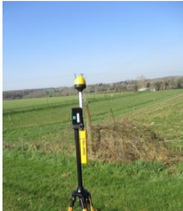
SAINT SENIER DE BEUVRON